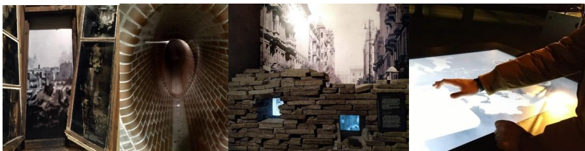
Εικόνα 5, 6, 7 & 8. Φωτογραφικό υλικό από το Μουσείο Εθνικής Εξέγερσης στην Βαρσοβία της Πολωνίας. Η διάδραση και η χρήση των ψηφιακών μέσων χρησιμοποιούνται για να καταστήσουν την μουσειακή εμπειρία αποδοτικότερη και απολαυστικότερη

Το «Hands-on» δεν είναι τόσο προσαρμόσιμο στο συγκεκριμένο εκπαιδευτικό πρόγραμμα, ενώ τα σημεία «μίλα» και «κοινωνικοποιήσου» είναι οι βάσεις για την υλοποίηση του προγράμματος « Το Μέγα Κάστρο μέσα από τα μάτια του Νίκου Καζαντζάκη », καθώς η επαφή με το ιστορικο-κοινωνικό πλαίσιο και στα τρία στάδια του προγράμματος είναι άμεση μέσω της συζήτησης και της αλληλεπίδρασης των δράσεών του. Έτσι, τα ζητούμενα εξελίσσονται σε δεδομένα. Παράλληλα, οι νέες γνώσεις για το ιστορικό-κοινωνικό πλαίσιο της Κρήτης σε συγκεκριμένη εποχή αναπροσαρμόζονται στις ήδη υπάρχουσες από την επαφή των μαθητών με τον Καζαντζάκη στο μάθημα της Λογοτεχνίας. Τα κίνητρα των μαθητών αποτελούν προσωπικά στοιχεία αλλά, σε γενικές γραμμές, μπορούν να κατανοηθούν ώστε να ληφθούν υπόψη και να αξιοποιηθούν καταλλήλως από το μουσείο.