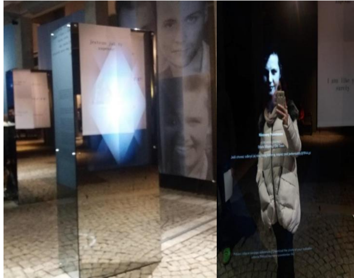
Εικόνα 3 & 4. Εικόνες από το Μουσείο Εθνικής Εξέγερσης στην Βαρσοβία. Η επίσκεψη στο συγκεκριμένο μουσείο είναι σχεδόν σε όλα της τα σημεία βασισμένη στην διαδραστικότητα και στην αυτομάθηση, στοιχεία που τονώνουν θετικά την μουσειακή εμπειρία