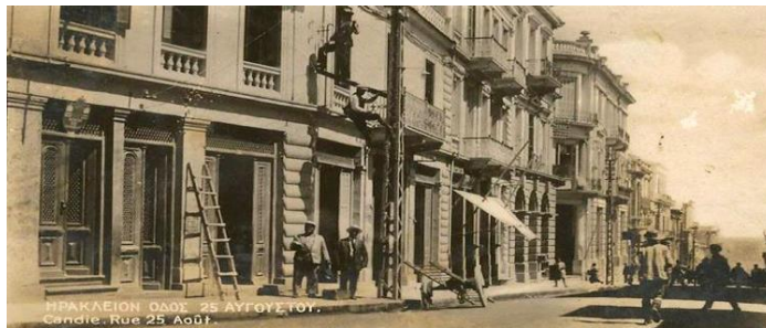
Εικόνα 2. Εικόνες όπως η ανωτέρω 8 (οδός ΒεζίρΤσαρσί ή αλλιώς οδός Πλάνης των τελών του 19 ου αιώνα και αρχών 20 ου -η σημερινή οδός Μαρτύρων 25 ης Αυγούστου-) θα μπορούσαν να είναι χαρακτηριστικές για την ξενάγηση μέσω 3D προγράμματος στο β' στάδιο (επίσκεψη στον μουσειακό χώρο) του προτεινόμενου εκπαιδευτικού προγράμματος

στους δρόμους του Ηρακλείου έτσι όπως τους περιέγραψε ο Καζαντζάκης έναν αιώνα πριν περίπου. Αυτός είναι ένας από τους τρόπους, ώστε το προτεινόμενο εκπαιδευτικό πρόγραμμα να χαρακτηρίζεται από διαδραστικότητα, αυτομάθηση και να καταλήγει σε θετική μουσειακή εμπειρία.