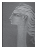
Εικόνα 6. Γυναικεία φιγούρα (Δ. Κατσικογιάννης)