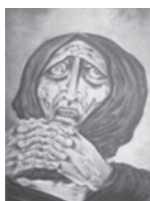
Η καρτερικότητα της Μάνας (Δ. Κατσικογιάννης)